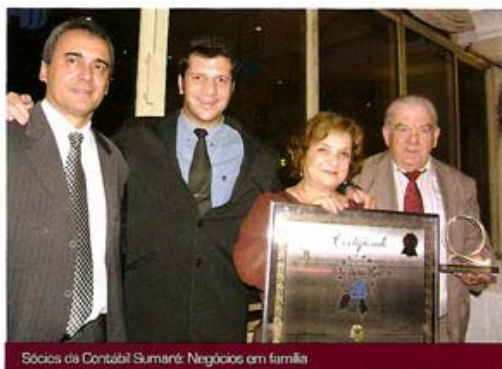
Sócios da Contábil Sumaré: Negócios em família

Bernhoeft ensina que devem ser criadas regras, normas e princípios que viabilizarão a continuidade do negócio, quando o fundador se afastar. Aliás, o processo sucessório deve ser discutido assim que os filhos começarem a trabalhar na empresa, entre todos os